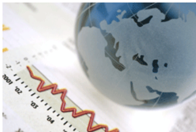
Number of arbitration cases registered by year