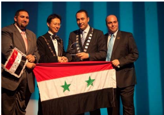
اتاق بین المللی جوانان دمشق - برنده جایزه طرح کسب و کار محلی سال ۲۰۱۱

جوایز توسعه کسب و کار ملی و محلی از سوی اتاق بازرگانی بین المللی (ICC) در طول بیست سال گذشته، به صورت سالانه به طرح های برتر در اتاق های بین المللی جوانان کشورهای مختلف اعطا شده است. هدف از برگزاری این مراسم سالانه و بررسی طرح های برتر، شناسایی اقدامات و نوآوری های صورت گرفته در اتاق ها پیرامون مسائلی نظیر سرمایه گذاری و همکاری بین المللی کسب و کار، توسعه تجارت و کسب و کار، تقویت مشارکت میان بخش دولتی، خصوصی، اتاق ها و انجمن های کسب و کار و گسترش برنامه های آموزشی و توسعه است.