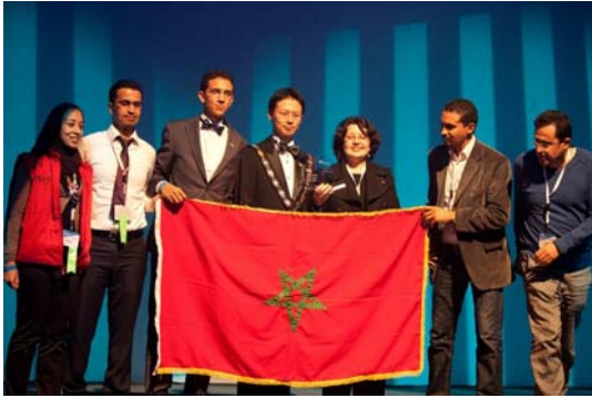
اتاق بین المللی جوانان مراکش - برنده جایزه طرح کسب و کار ملی سال ۲۰۱۱

جوایز توسعه کسب و کار ملی و محلی از سوی اتاق بازرگانی بین المللی (ICC) در طول بیست سال گذشته، به صورت سالانه به طرح های برتر در اتاق های بین المللی جوانان کشورهای مختلف اعطا شده است. هدف از برگزاری این مراسم سالانه و بررسی طرح های برتر، شناسایی اقدامات و نوآوری های صورت گرفته در اتاق ها پیرامون مسائلی نظیر سرمایه گذاری و همکاری بین المللی کسب و کار، توسعه تجارت و کسب و کار، تقویت مشارکت میان بخش دولتی، خصوصی، اتاق ها و انجمن های کسب و کار و گسترش برنامه های آموزشی و توسعه است.