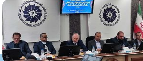
دیدار دبیر کل کمیته ایرانی ICC با فعالان اقتصادی استان زنجان

همچنین موارد تأمین منابع مالی از طریق روش‌های نوین، راهبردهای جذب و تأمین مالی در بخش کشاورزی، راهبردهای سرمایه‌گذاری مستقیم خارجی، روندهای اخیر سرمایه‌گذاری، اهمیت تأمین مالی، روش‌های نوین سرمایه‌گذاری خارجی، تشویق و تسهیل سرمایه‌گذاری در بخش کشاورزی، انواع سرمایه‌گذاری خارجی، ترتیبات قراردادی در سرمایه‌گذاری خارجی به تفصیل مورد بحث و بررسی قرار گرفت