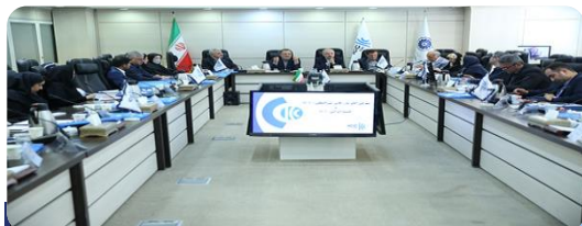
برگزاری اولین جلسه حضوری نمایندگان رابط اتاق‌های بازرگانی سراسر کشور به میزبانی کمیته ایرانی ICC

کمیته ایرانی اتاق بازرگانی بین‌المللی، اولین جلسه حضوری نمایندگان رابط اتاق‌های بازرگانی سراسر کشور را در سال ۱۴۰۲ به ریاست دبیرکل کمیته ایرانی ICC و با حضور نمایندگان رابط معرفی شده از سوی اتاق‌های بازرگانی استان‌ها و معاون استان‌ها و تشکل‌ها، اتاق بازرگانی، صنایع، معادن و کشاورزی ایران در تاریخ ۹ خرداد ۱۴۰۲ برگزار نمود.