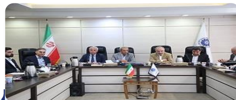
برگزاری انتخابات هیات ریسه کمیته ایرانی اتاق بازرگانی بین‌المللی (ICC Iran)

انتخابات هیات ریسه کمیته ایرانی اول خرداد ماه با حضور ۲۱ عضو شورای کمیته ایرانی حاضر از ۲۴ عضو، برگزار گردید.