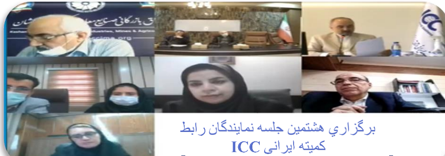
برگزاری هشتمین جلسه نمایندگان رابط کمیته ایرانی ICC